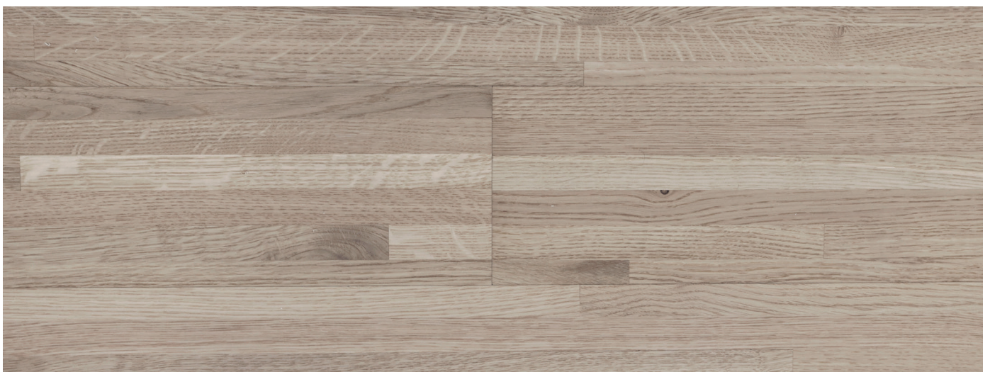
senza leggero smusso

I ritratti mostrano la gamma di possibili colori.