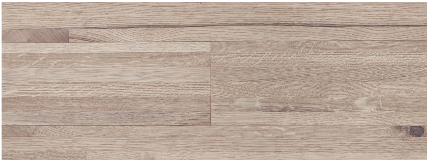
con leggero smusso